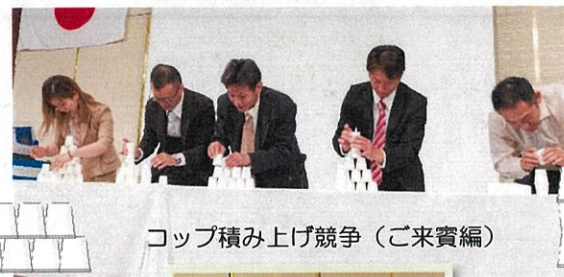
コップ積み上げ競争 (ご来賓編)