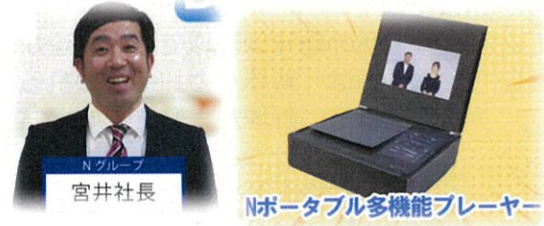
Nグループ 宮井社長 Nポータブル多機能プレーヤー んんん…どこかで見たCM 会場大爆笑でした