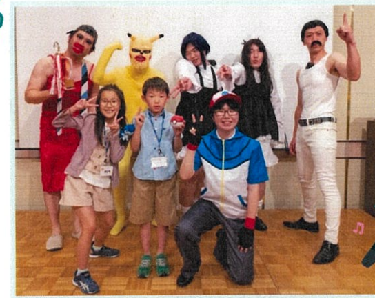
子供たちもステージで盛り上げてくれました