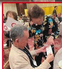
お二方、クイズの答えをカンニングしてるじゃん 逮捕よ