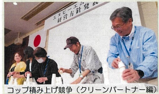
コップ積み上げ競争 (クリーンパートナー編)