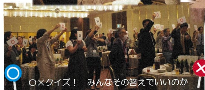
〇×クイズ！ みんなその答えでいいの？