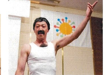
フレディ・マーキュリー 会場を一体化にしようと カモンの掛け声ばかりだったような… 歌ってた??