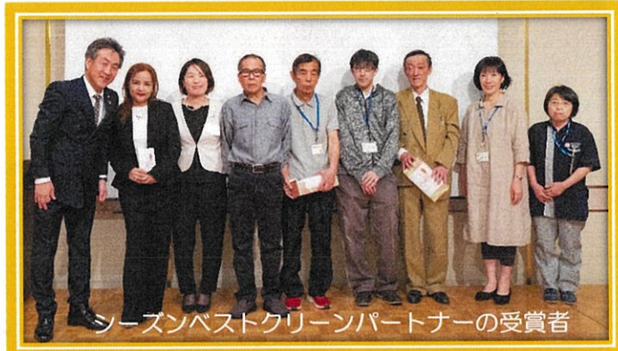
27期ベストクリーンパートナーの受賞者