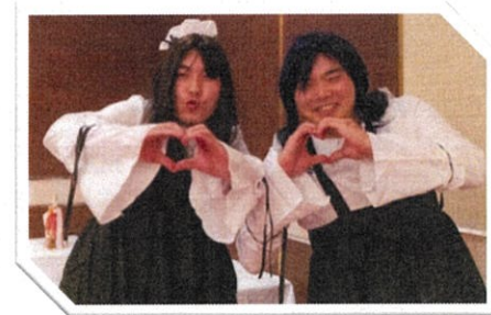
あらっ とても似合ってるじゃない