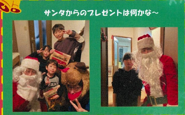
サンタからのプレゼントは何かな～