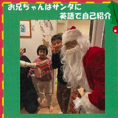
お兄ちゃんはサンタに英語で自己紹介