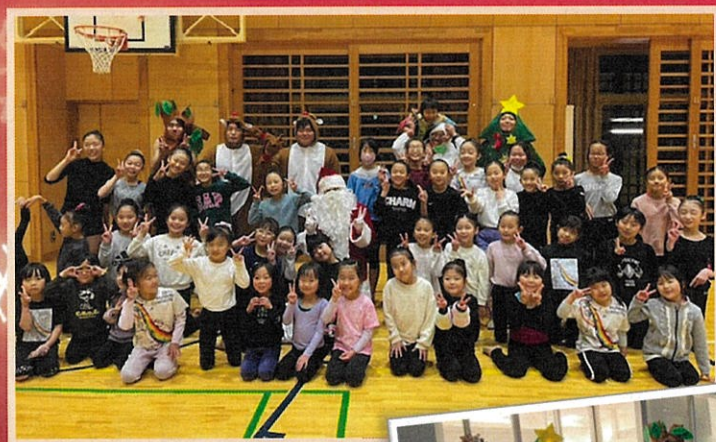
東京サンタチーム