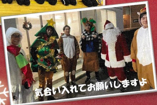
気合い入れてお願いしますよ