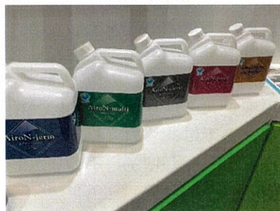
実際の製品紹介やパネルや事例等を展示