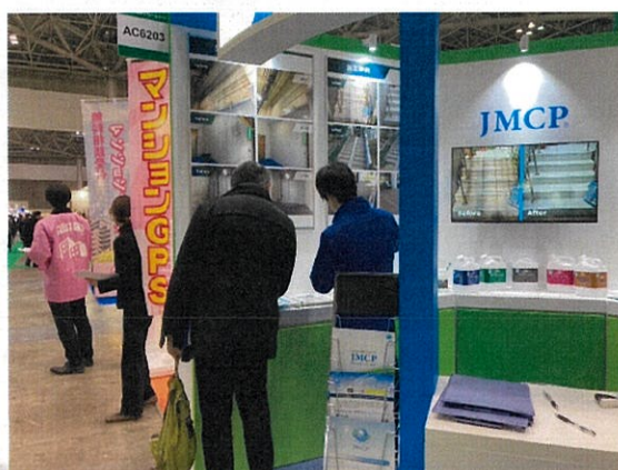
接客は 接客中の谷本君 上手く伝えられたかな