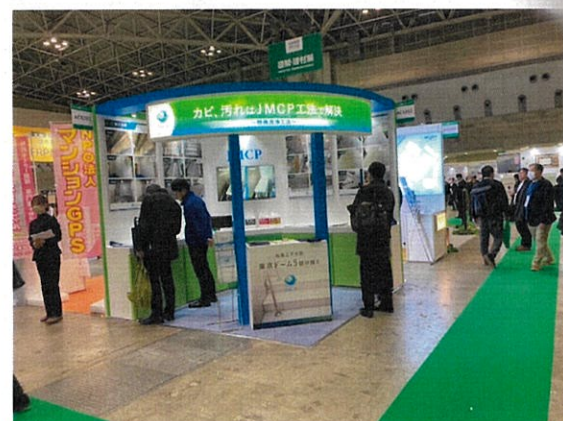
お任せください By 谷本

こちらが前回のJMCPのブースです ホワイトメインの配色ですね 少し寂しい感があります