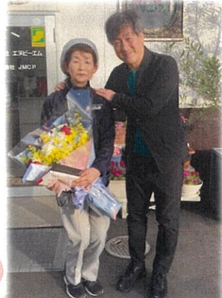
社長から花束をプレゼント