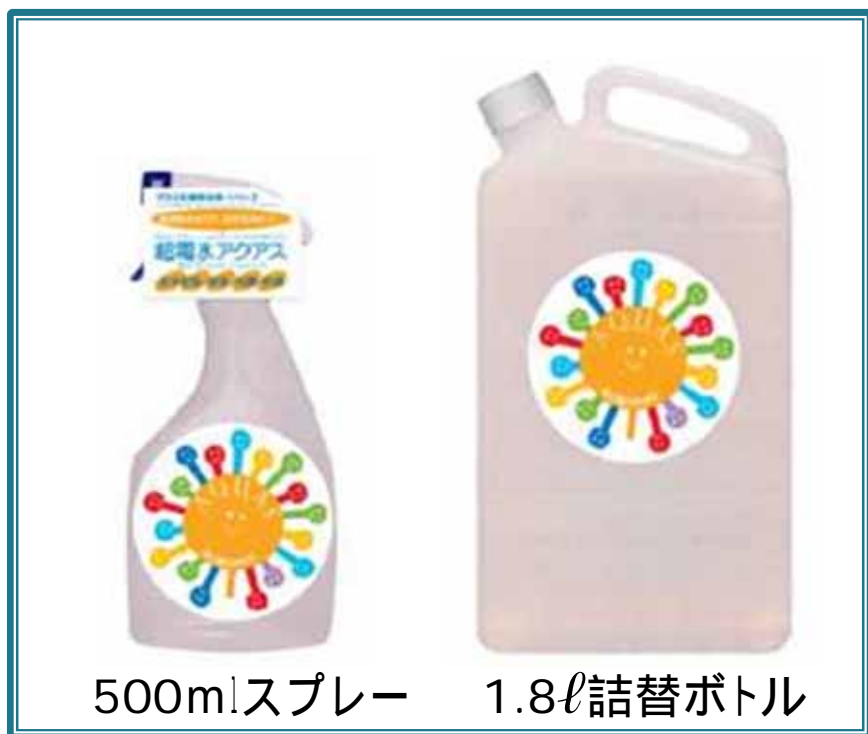
500mlスプレー 1.8ℓ詰替ボトル