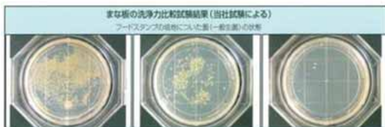
1. 洗浄前 2. 水道水 3. アクアス

アクアスは、除菌に大きな効果を発揮します。O-157やサルモネラ菌を30秒で除去します。